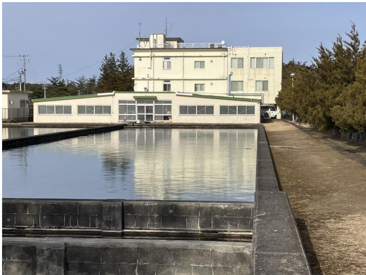
梅の宮浄水場・管理棟