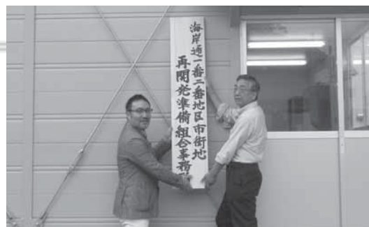
▲事務所の看板を設置する役員の皆さん