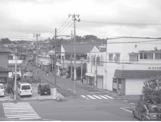
▲現在の藤倉二丁目地区

土地区画整理事業を実施するにあたり、法律に基づき、事業に関する基本的な事項について条例で定めることとされています。今回の6月定例会に条例案を提案し、施行規程と区画整理事業特別会計を創設します。地権者の皆さんを対象に事業に関する勉強会を定期的に開催し、今後必要な手続きや用地の買い取りなど、具体的な説明を行い、質疑応答が活発に行われていきます。県に事業認可申請を行い、認可後に事業に着手していきます。