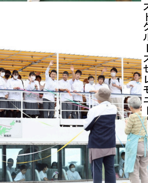
さよならしおじ ラストクルーズセレモニー