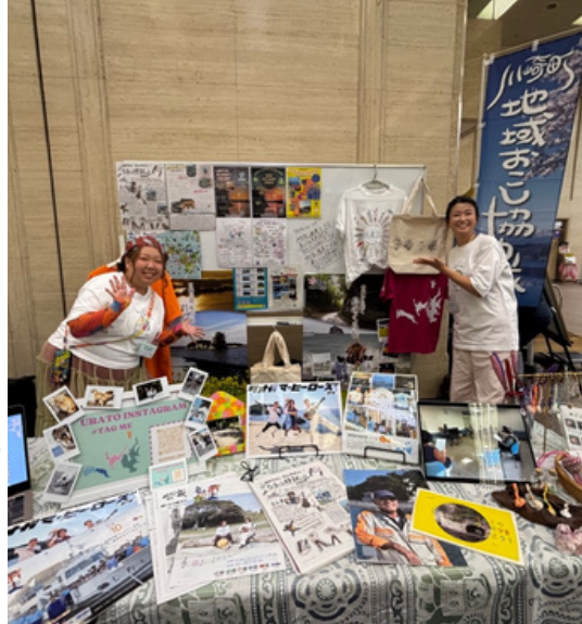
島人アルバム 活動レポート