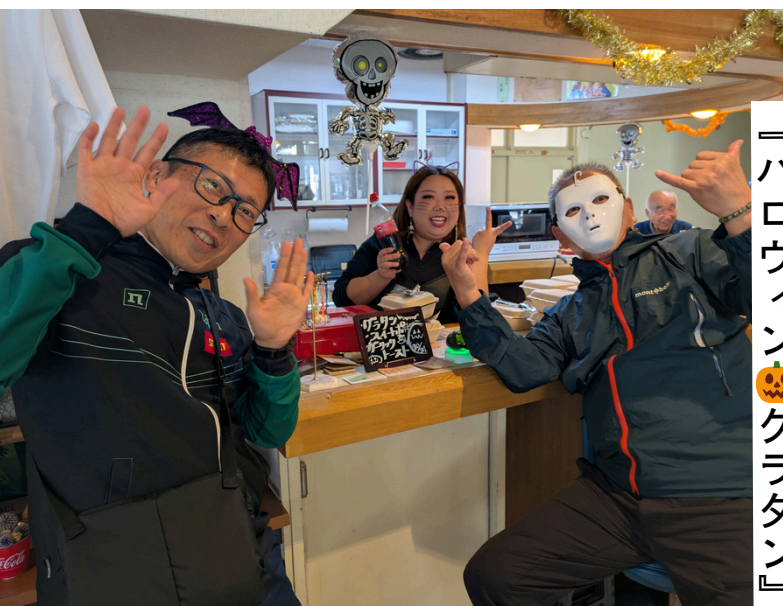
『ハロウィン🎃グラタン』