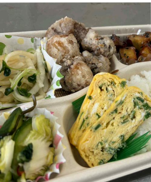
市政教室 『島食材*タコからあげ弁当』