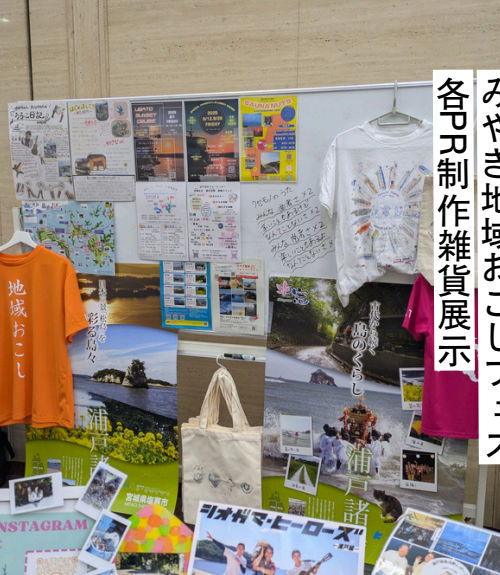
みやぎ地域おこしフェス 各町制作雑貨展示