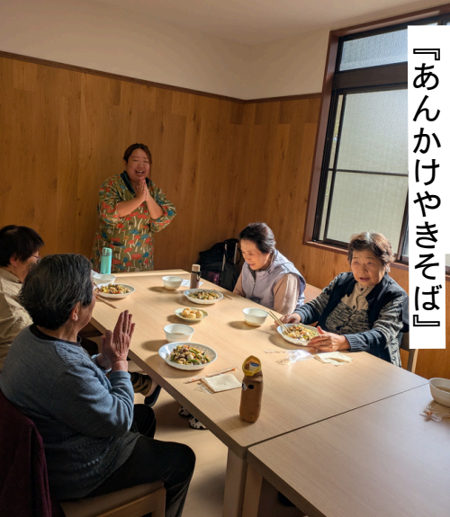
『あんかけやきそば』 桂島みんな食堂