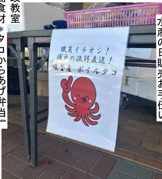
漁協タコ処理 水産の日販売お手伝い