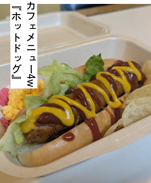
カフェメニュー4w 『ホットドッグ』