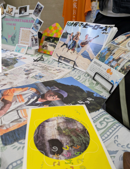
ハンドメイド雑貨 デザインシャツ・チラシ