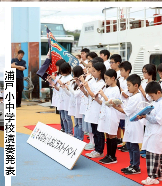
浦戸小中学校演奏発表