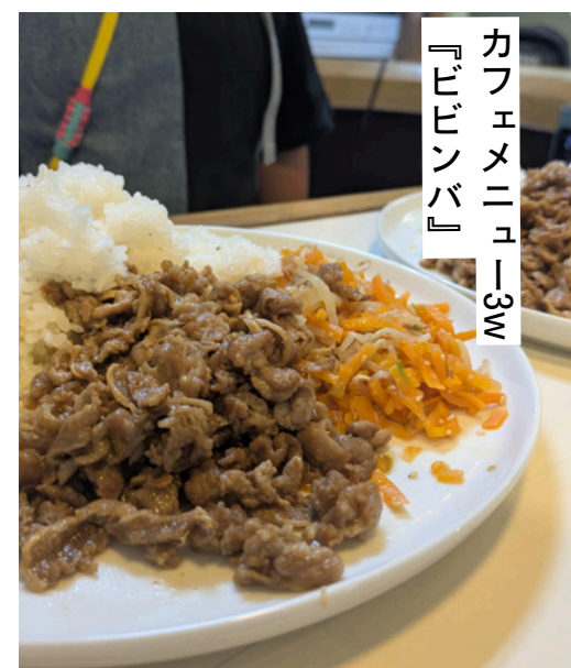
カフェメニュー3w 『ビビンバ』