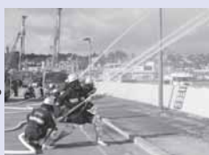
出初式での放水訓練

市内在住または在勤の18歳以上の健康な方が消防団員になることができ、非常勤の特別職地方公務員として、市から報酬などが支給されます。