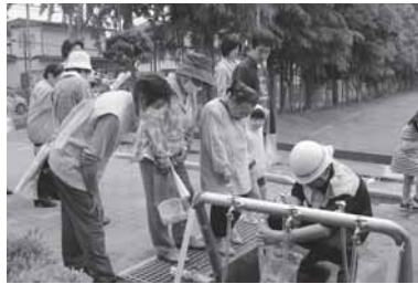
昨年は清水沢公園で給水訓練を行いました。