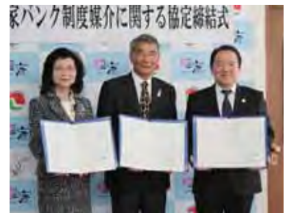
宮城県宅地建物取引業協会、全日本不動産協会宮城県本部と媒介に関する協定を締結しています。