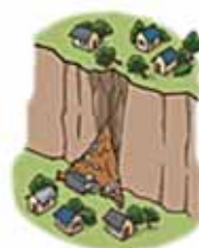
イラスト:「政府広報オンライン」転載