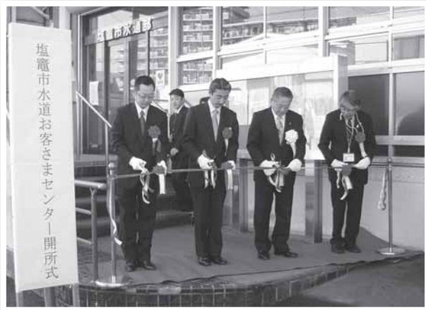
▲塩竈市水道お客さまセンター開所式の様子