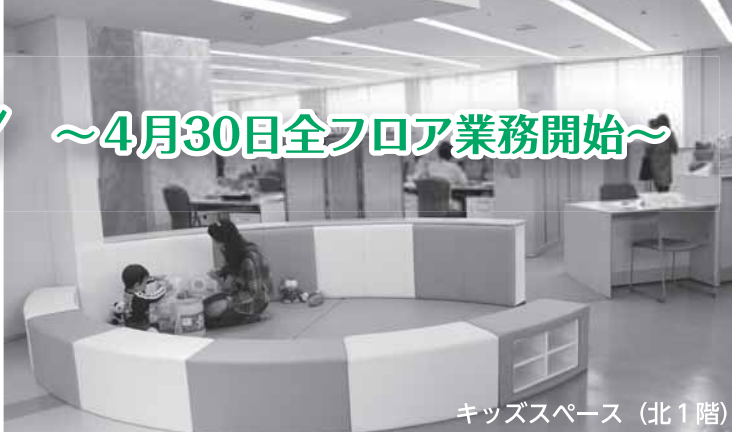
キッズスペース（北1階）