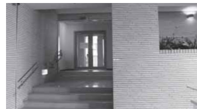
北2階と南2階を → 結ぶ「連絡通路」

北2階と南2階を結ぶ「連絡通路」を整備し、南北2階部分において最短でのアクセスが可能になりました。