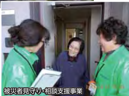
▲災害公営住宅で暮らす高齢者などに対する日常的な見守り・相談支援を実施します