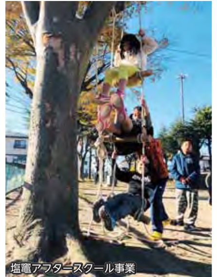
塩竈アフタースクール事業

▲子どもが安心して充実した放課後を過ごせるよう、「わくわく遊び隊」と「ほっとスペースづくり」に取り組んでいます