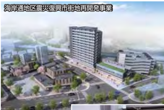
▲現在一番地区の工事が進められており、今年度末の完成が予定されています