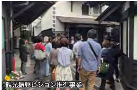
観光振興ビジョン推進事業

▲子どもが安心して充実した放課後を過ごせるよう、「わくわく遊び隊」と「ほっとスペースづくり」に取り組んでいます