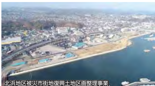
北浜地区被災市街地復興土地区画整理事業