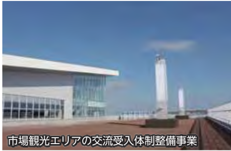
市場観光エリアの交流受入体制整備事業

▲小中学校間における交流活動のひとつとして、中学生が小学生の学習を支援しています