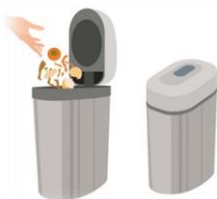
② バイオ式 生ごみ処理機