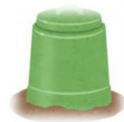
④ 生ごみ堆肥化容器