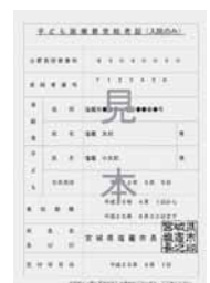
見本②・うぐいす色