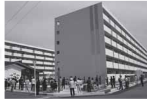
◀昨年9月に完成した清水沢地区災害公営住宅