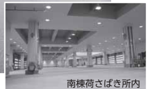
南棟荷さばき所内