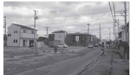
▲引き渡しを受けた方から、着々と新築工事が始まっています。