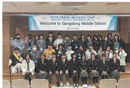
江東（カンドン）中学校での交流活動