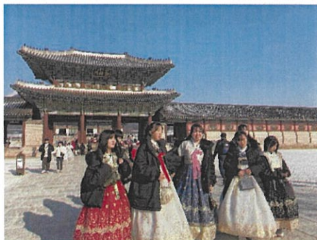
韓服を着て韓国を代表する古宮・景福宮を訪問