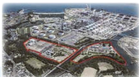
赤枠部分が仙塩浄化センター敷地

平成23年3月11日に発生した東日本大震災により甚大な被害を受けましたが、段階的に復旧作業が進められ、平成25年3月に完全復旧しました。