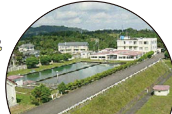
梅の宮浄水場 昭和38年に建設