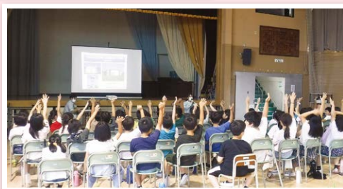
玉川小学校での水道教室の様子