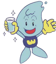
仙台市水道局 ウオッター君

令和5年4月11日 仙台市役所にて、仙台市と塩竈市は、共同浄水場及び関連施設の整備事業の実施に関する基本協定を締結しました。共同浄水場の整備は、令和18年度供給開始を目指し、共同で進めています。