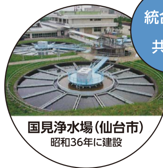
国見浄水場(仙台市) 昭和36年に建設