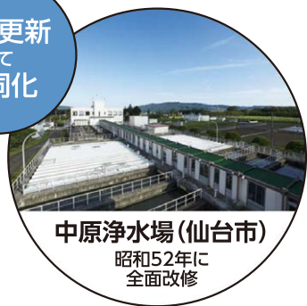
中原浄水場(仙台市) 昭和52年に 全面改修