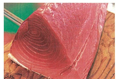
※写真は前年度の開催状況です