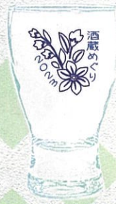
▲オリジナルグラス (イメージ)

おつまみ(玉こんにゃく・笹かまぼこ)&グラス付チケットを購入して、オリジナル試飲グラスを使い、3つの酒蔵を巡るイベントです。 3蔵全てを巡った後は、「釜's BAR」へ。“お気に入りのお酒”をもう一杯サービスしています。 ※各試飲&おつまみ交換場所・釜's BARは、裏面の地図でご確認ください。