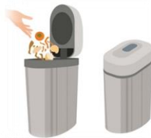
② バイオ式 生ごみ処理機