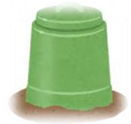
④ 生ごみ堆肥化容器