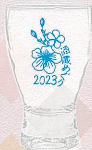
▲参加記念グラス（イメージ）