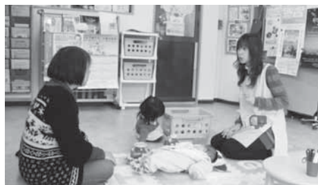
子育て支援センター