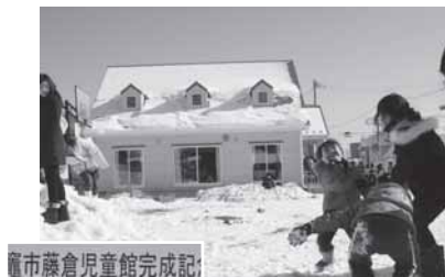
滝市藤倉児童館完成記

年が明けてすぐ1月19日に新児童館がオープンしました。新児童館は白い壁と緑の三角屋根が特徴です。赤ちゃんからお年寄りの方々まであたたかく迎える、お日さまのような児童館をイメージしました。復興のシンボルとして、子どもたちや地域の方々の笑顔を取り戻すよう元気を発信します。