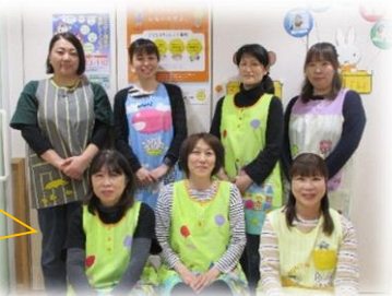
令和4年度の職員です