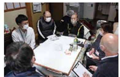
支援者が介護認定をもつ方の避難支援方法を話し合っています