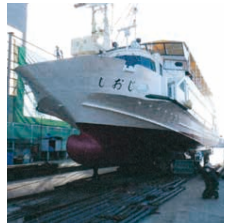
浦戸地区を結ぶ市営汽船の安全な運航のため、船舶の点検整備を行います