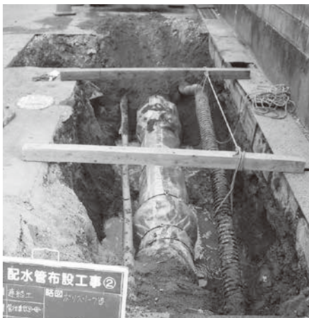
安定した水道供給のため管路の更新工事などを行います