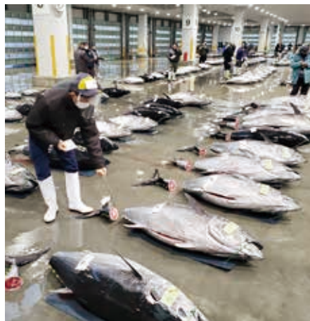
衛生管理が行き届いた魚市場の運営を行います