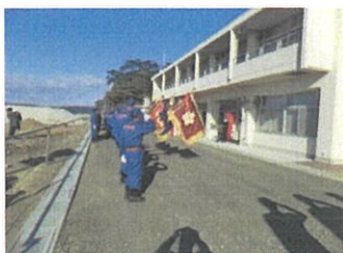
観閲式 (令和2年 浦戸消防団)