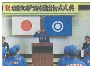
式典 (令和2年 浦戸消防団)