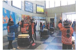
藤倉まつり太鼓 (藤倉保育所)