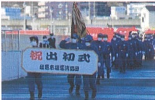
観閲式 (塩竈消防団)