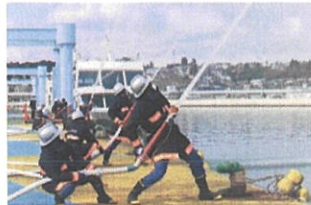
一斉放水 (塩竈消防団)