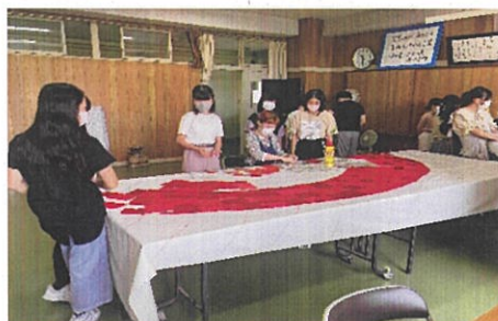
アーティストによる土台布の作成