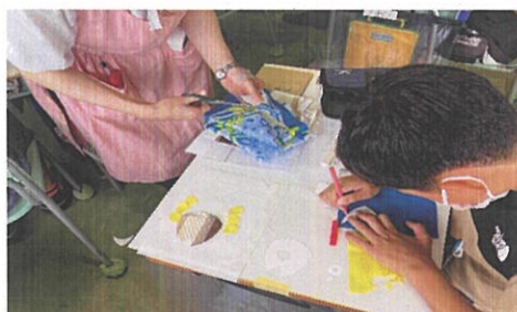
アーティスト指導のもと思い出のある布で 「魚」「鳥」を作成