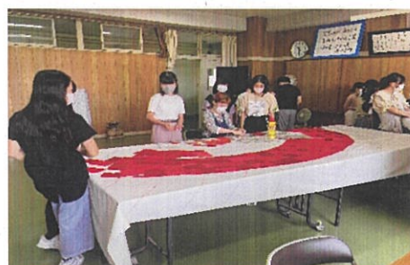
アーティストによる土台布の作成