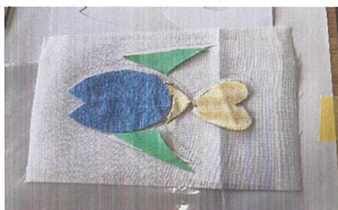
児童が作成した「鳥」