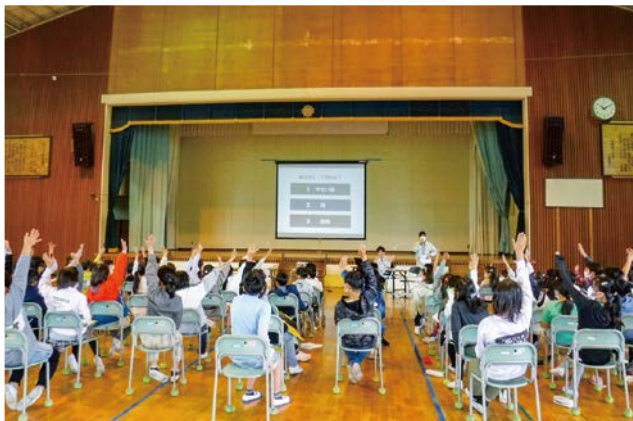
杉の入小学校での水道教室の様子

シオンちゃん水道教室は、水の大切さや水道水についての正しい知識を提供するため小学生を対象に授業を行っているものです。新型コロナウイルス感染拡大防止のため令和2～3年度は開催を見送っていましたが、今年は3年ぶりに開催することができました。スライドで塩竈の水道の歴史などを説明した後に、利き水や簡易ジャーテスト(薬品を使用した凝集実験)を行いました。真剣に説明を聞き、メモを取る姿が印象的でした。