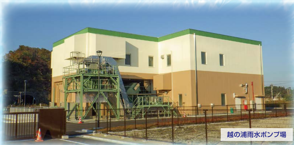
越の浦雨水ポンプ場

頭上にある『ひしゃく』の形をした北斗七星のデザインは昔、塩竈の水を支えた七つの湧き水に由来しているんだよ!