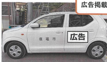
広告掲載イメージ