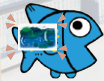
利用券をもって図書館へ

図書・雑誌を合計15冊まで予約できます。 (CD/DVDはインターネットで予約できません)