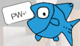
パスワードを発行