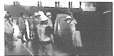
【令和3年度の訓練の様子】

市職員を中心に「感染症対策に配慮した指定避難所の運営」について訓練や説明を行いました