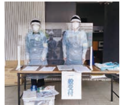
令和3年の訓練では、感染症対策に配慮した訓練を行いました