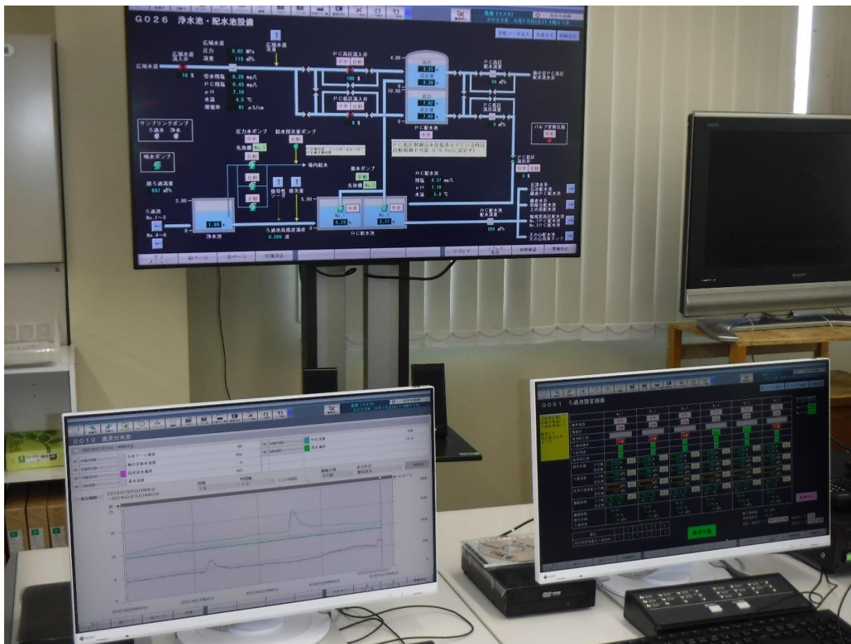
梅の宮浄水場・中央管理室