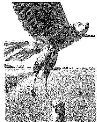
「The Pillar」