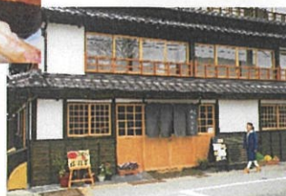
写真はイメージです