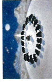
なめとこ山の熊/宮沢賢治