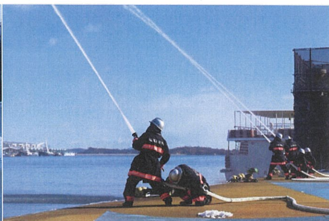
一斉放水（令和3年 塩竈消防団）

連絡先：塩竈市市民総務部市民安全課防災係 担当・堀江、鈴木 電話 022-355-6491