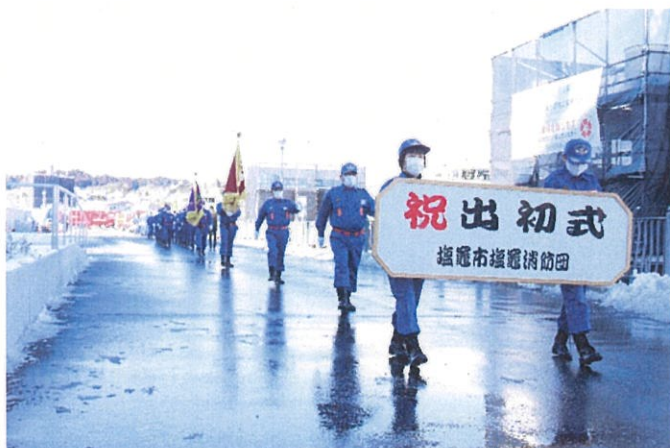
観閲式（令和3年 塩竈消防団）