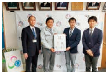
選考委員会での結果を市長に報告