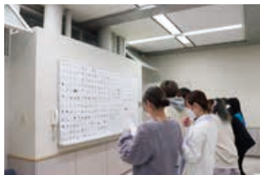
宮城大学では約100人が投票

塩竈の産業・文化等全てから湧き出る、日本人特有の奥ゆかしくも力強い活気を可能な限りシンプルに、かつ多くの人に認知してもらえるようデザインしました。表現できておりましたら幸いです。改めて受賞のお礼を申し上げますと共に、塩竈市の益々のご発展をお祈り申し上げます。