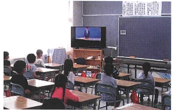
オンラインでのクラス風景

※1 蒲鉾が初めて文献に登場したのが、「1115年の関白右大臣が東三条への引っ越しの祝宴の膳に描かれていたもの」であることから、全国蒲鉾水産加工業協同組合連合会が、1983年(昭和58)に制定しました。