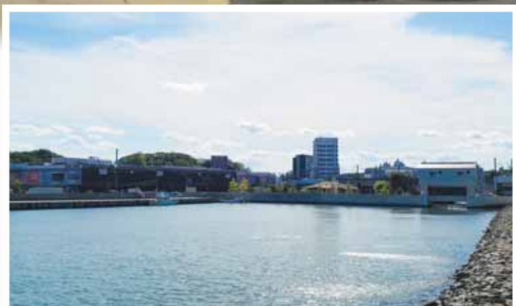
現在の海岸通。東日本大震災以降、まちを守るための水門が整備されました。