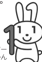
マイナンバーキャラクター マイナちゃん

個人番号カードの申請をされた方がカードを受け取る際、市役所で「暗証番号」の登録が必要です。あらかじめ「暗証番号」を決めておいてください。