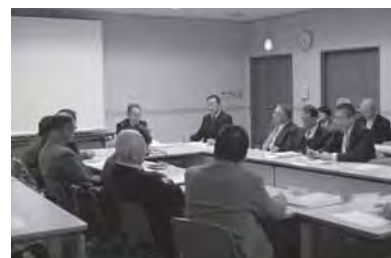
◀会議では有識者の方、市民の方からの意見交換が行われました