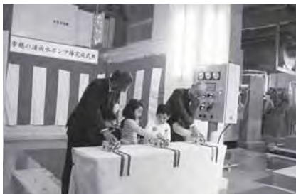
▲新浜町保育所の子どもたちも一緒に、ポンプ始動のボタンを押しました