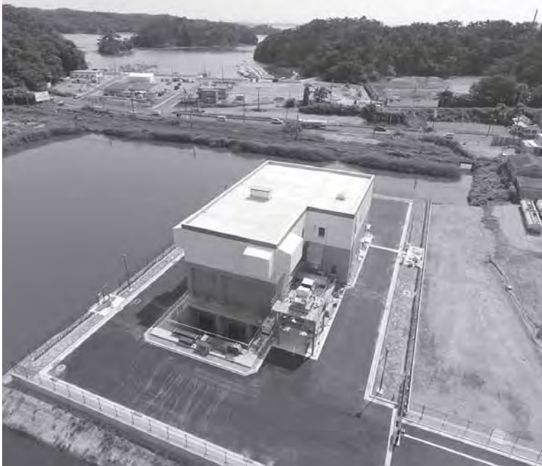
上空からの越の浦雨水ポンプ場