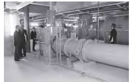
▲排水ポンプが3基設置されています