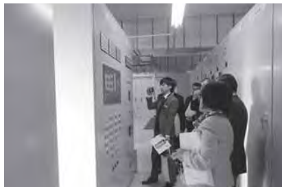
▲電気設備があり、排水量などのポンプの稼働状況を管理する機器などが設置されています