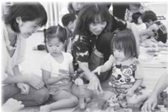
▲毎日、たくさんの親子連れでにぎわう、しおがま子育て支援センター「こころん」

議長 市民の皆さんや子育て中の方にまちづくりに参画していただいて、新しい塩竈をつくっていく時期に来ていると思います。行政や議会へのご提案を私たちも真摯（しんし）に受け止めていきます。