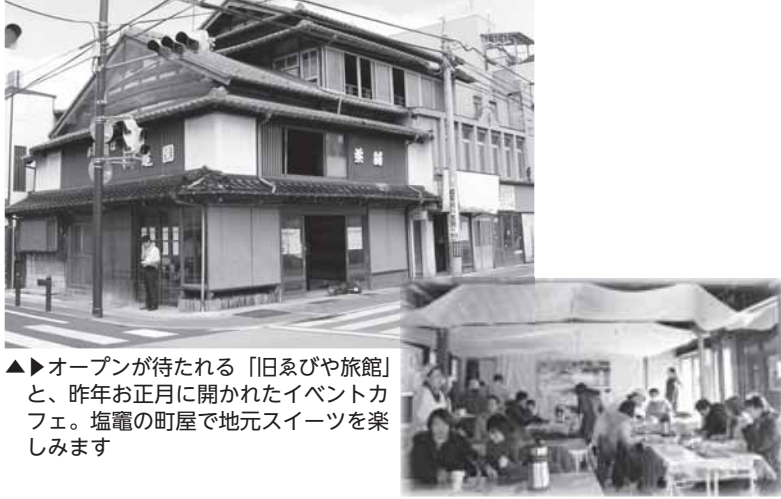
▲▶オープンが待たれる「旧ゑびや旅館」と、昨年お正月に開かれたイベントカフェ。塩竈の町屋で地元スイーツを楽しみます