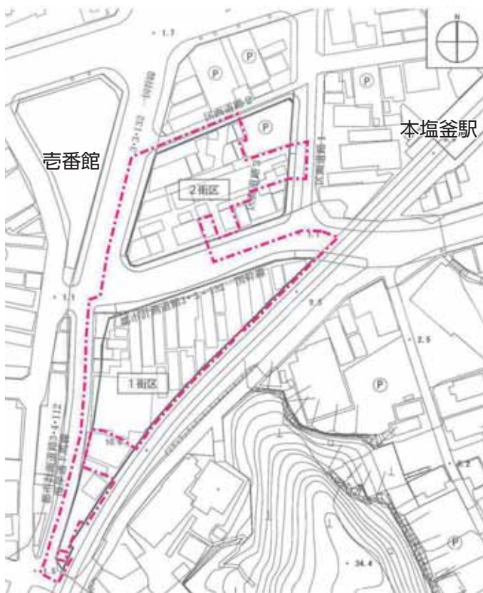
▲市街地再開発事業の施行区域 (点線)

今後、事業計画を具体化し、権利者の同意を得て県に事業認可申請を行います。事業の実現に向けて少しずつ前進しています。