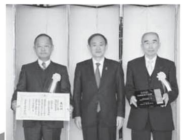
11月26日 内閣総理大臣官邸にて

安倍総代理で菅官房長官より表彰され、会場で、よしこの塩竈の踊りを披露しました。授与された賞状および楯はJRB塩釜駅前の塩竈観光物産案内所に展示しています。