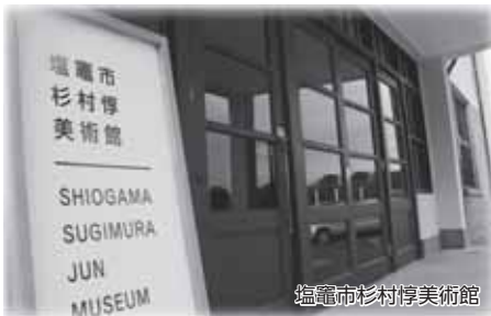
塩竈市杉村淳美術館

今回の新春座談会では、観光、教育、まちづくりの分野で活動されるゲストの方々をお迎えし、市長、議長とこれからのまちづくりについてお話いただきました。