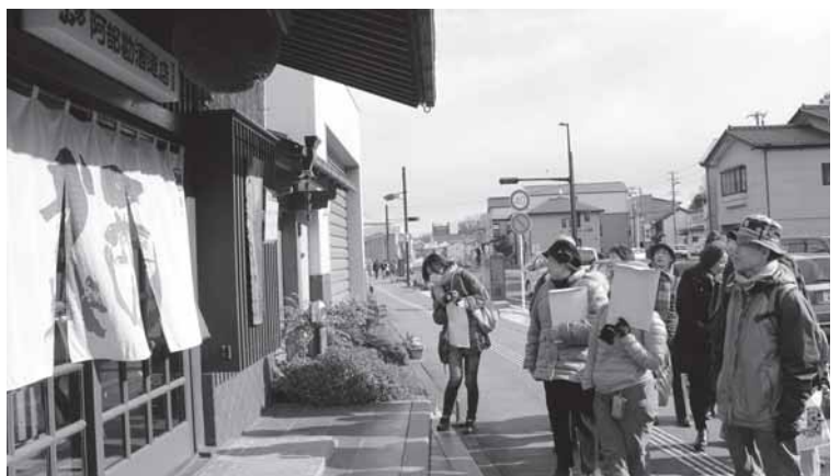
▲駅長オススメの小さな旅「塩竈酒蔵めぐり」を楽しむ観光客の皆さん