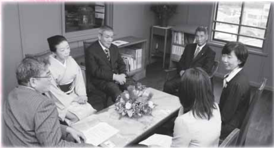
▲新春座談会は12月1日「塩竈市杉村惇美術館 サロン」で収録しました