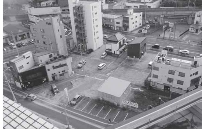
▲再開発事業で新たなまちに生まれ変わる海岸通1番2番地区

今後は、杉村惇美術館、旧ゑびや旅館、亀井邸、そして鹽竈神社というような観光動線ができれば、さらに魅力が高まるのではと期待しています。