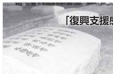
「復興支援感謝の碑(いしぶみ)」