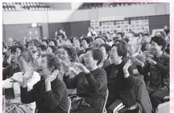
▼生涯現役を目標に、ダンベルサークルで健康づくり