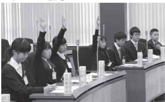
▼小学生が塩竈のまちづくりを真剣に考え、議論する「こどもゆめ議会」

市長 出席者の皆さんの「塩竈が大好き」というお気持ちは何よりもうれしかったです。これからのまちを担う子どもたちが大きく羽ばたき、「ふるさととは塩竈です」と誇りを持っていただけるような「まちづくり」の素材を皆さんからたくさん頂きました。私にとって何よりのお年玉でした。今年も皆さんとしっかりと頑張っていきたいと思います。ありがとうございました。