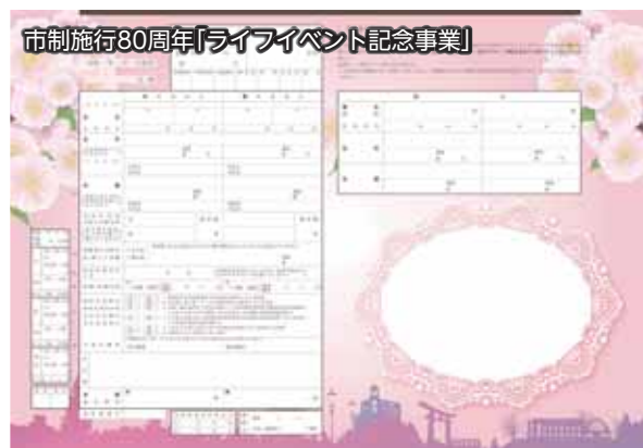
市制施行80周年「ライフイベント記念事業」

▲現在の伊保石公園展望台からの眺望。市民の方の憩いの場として、さらに活用いただけるよう取り組んでいきます