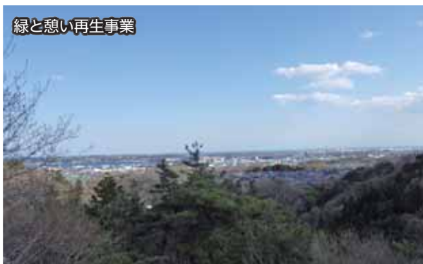
緑と憩い再生事業

▲現在の伊保石公園展望台からの眺望。市民の方の憩いの場として、さらに活用いただけるよう取り組んでいきます