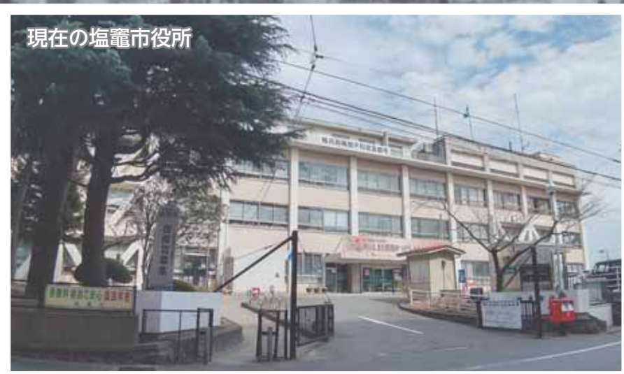
現在の塩竈市役所