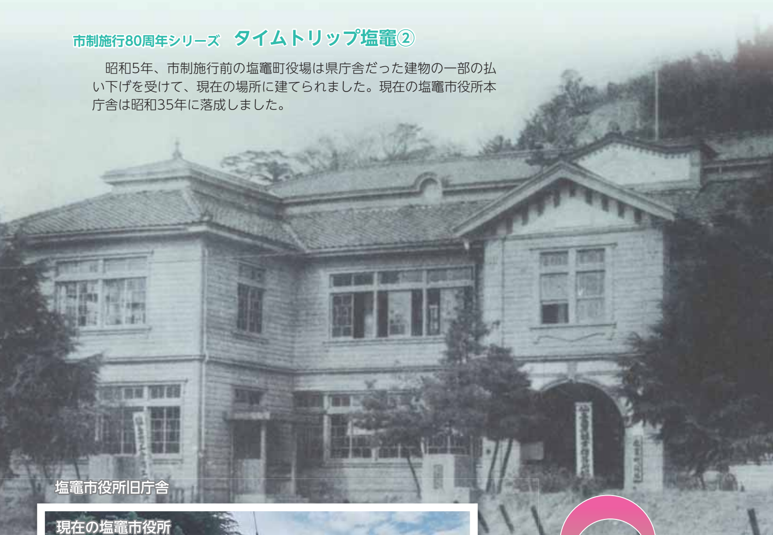
塩竈市役所旧庁舎

昭和5年、市制施行前の塩竈町役場は県庁舎だった建物の一部の払い下げを受けて、現在の場所に建てられました。現在の塩竈市役所本庁舎は昭和35年に落成しました。