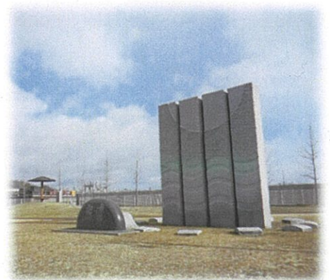
塩竈市東日本大震災モニュメント