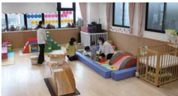
休館日に開催するので、スタッフとゆっくり話せます

「子育て支援センターこころん」に来館したことがない親子を対象に「はじめてのこころん」を開催します。