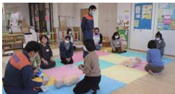
協力会員は救命救急法の研修を受講します

ファミサポ協力会員とは、市内にお住まいで、心身健康で安全に子どもを預かることができる、20歳以上の方の有償ボランティアです。