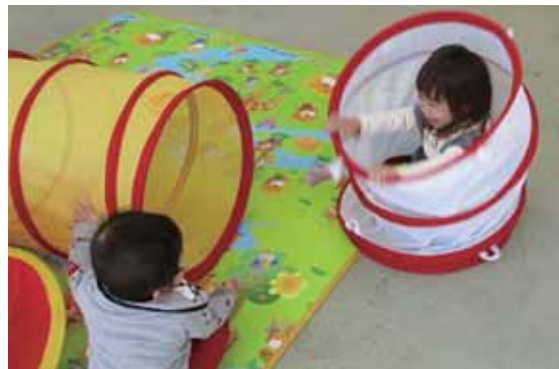
令和2年度は、楓町集会所や大日向集会所などで開催しました