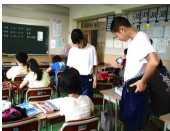
「どれどれ」児童の学習をみる中学生の皆さん（7月31日・三小）