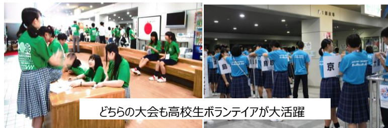
どちらの大会も高校生ボランティアが大活躍