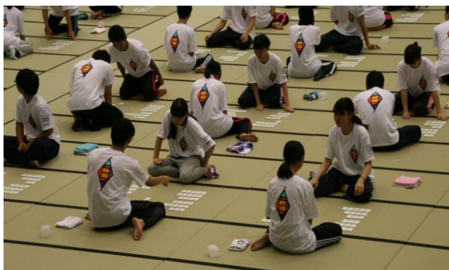
「畳の上の格闘技」かるた競技