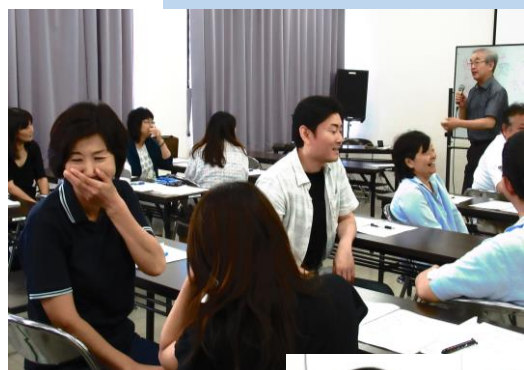
なごやかな雰囲気の中研修に参加する皆さん（公民館にて）