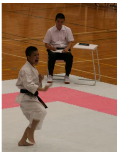
少林寺拳法大会。拳士の皆さんの表情