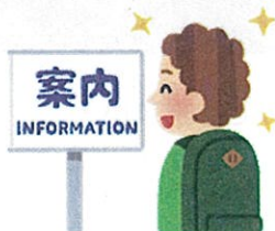
案内表示の多言語化