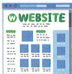
ホームページの多言語化