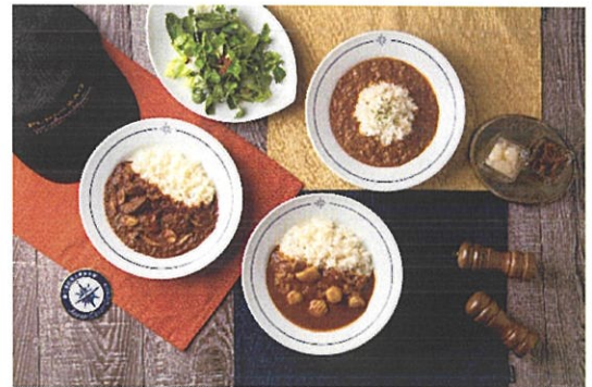
塩竈からの一品は「みなと塩竈海保カレー」