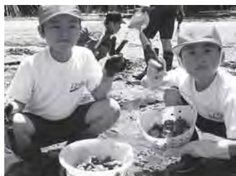
学校浜で「アサリ採取」