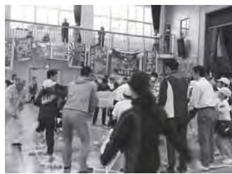
運動会は「家庭・学校・地域の絆」