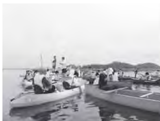
浦戸の海で「カヌー体験」